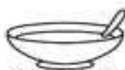
sopa con avena