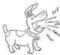
el sonido de un perro ladrando