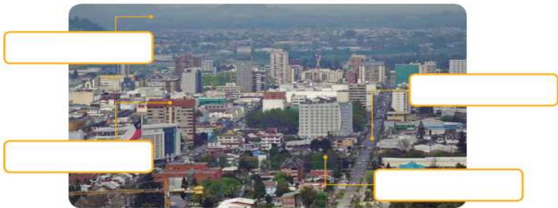
▲ Temuco, región de La Araucanía, Chile.

Ahora que conoces los diferentes elementos del paisaje, rotúlalos o nómbralos en las siguientes imágenes. Luego, descríbelas explicando los elementos que ves y su ubicación.