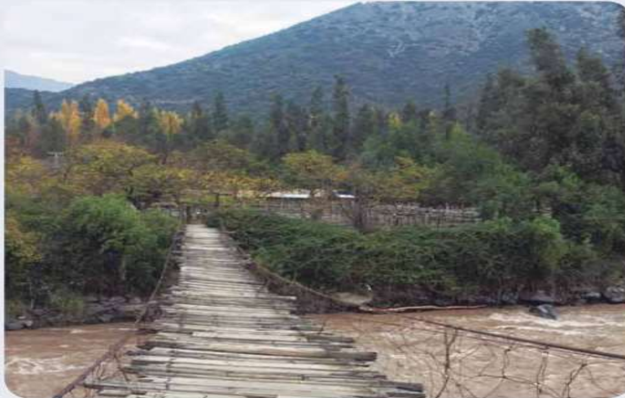
▲ Cajón del Maipo, región Metropolitana, Chile.

2. Escribe algunos elementos propios de la naturaleza que hay en la imagen.