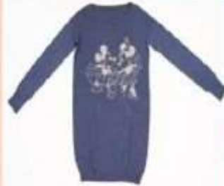
Camisetas de Manga larga