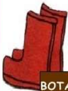
BOTAS DE AGUA